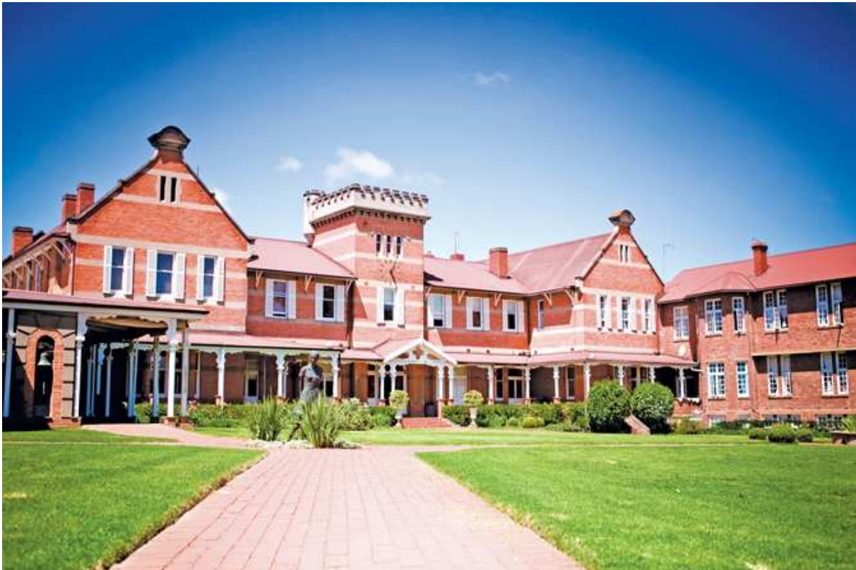
St Anne's Diocesan College, Hilton, South Africa

Im Zeitraum zwischen Ende September und Ende November können zwei Schülerinnen unserer Schule mit zwei Südafrikanerinnen ihre Plätze tauschen. Die deutschen Mädchen fliegen unbegleitet nach Pietermaritzburg, werden an St Anne's im Internat untergebracht und verbringen ein Term an der Schule, während ihre deutschen Familien gleichzeitig ihre südafrikanische Austauschpartnerin aufnehmen. In der ersten und letzten Austauschwoche werden die vier Schülerinnen in Südafrika bzw. Deutschland zusammenkommen. Es entstehen keine Kosten für Schulgeld, Unterrichtsmaterialien, Uniformen oder Internatsunterbringung. Zu zahlen bleibt nur der reine Flugpreis (max. Euro 1300.-), Kosten für Ausflüge sowie das Taschengeld. Es wäre wünschenswert, dass die deutschen Eltern (und Gastgeschwister) über grundlegende englische Sprachkenntnisse verfügen, da die Mädchen kein Deutsch sprechen.