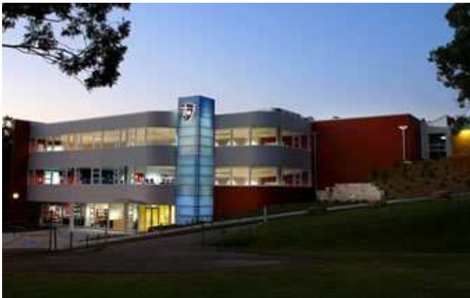
John Paul College, Daisy Hill, QLD, Australia

We believe our College offers students and staff an environment where Christian values are embraced and mutual respect offers a hand that reaches out and welcomes all cultures and faiths; and where the potential for our students is unlimited.”