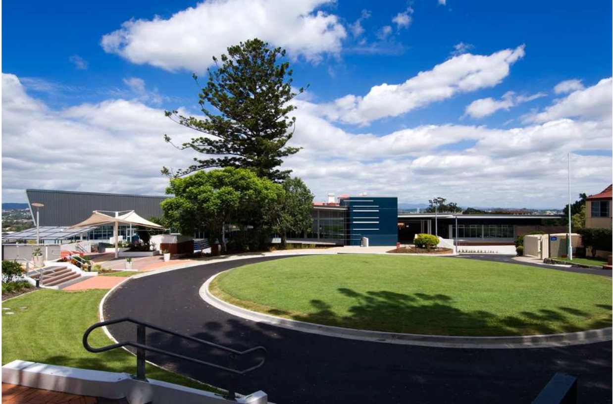
St Margaret's Anglican Girls School Science and Resource Centre, Ascot, QLD, Australia

“In a supportive Christian environment, reflecting the philosophy of the Sisters of The Society of the Sacred Advent, St Margaret's Anglican Girls School aims to provide excellence in teaching and learning within a broad, balanced and flexible curriculum complemented by other school activities, preparing confident, compassionate, capable women able to contribute in a global community. The School's six core values of spirit, faith, integrity, courage, respect and passion are embedded in every endeavour that the students undertake.”